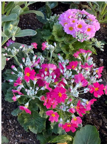
サクラソウ 東海市