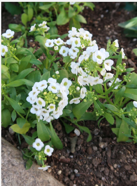
アリッサム 稲沢市