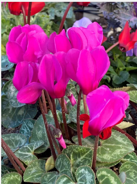
ガーデンシクラメン 東海市